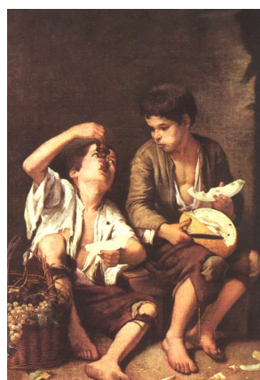
Niños comiendo uvas y melón

Ribalta (1565-1628). Gran naturalismo, pertenece a la escuela valenciana. Obras: Cristo abrazado a San Bernardo, San Bruno, etc.